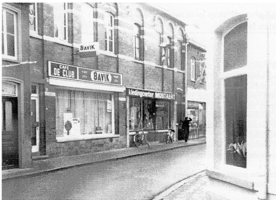
Café De Club