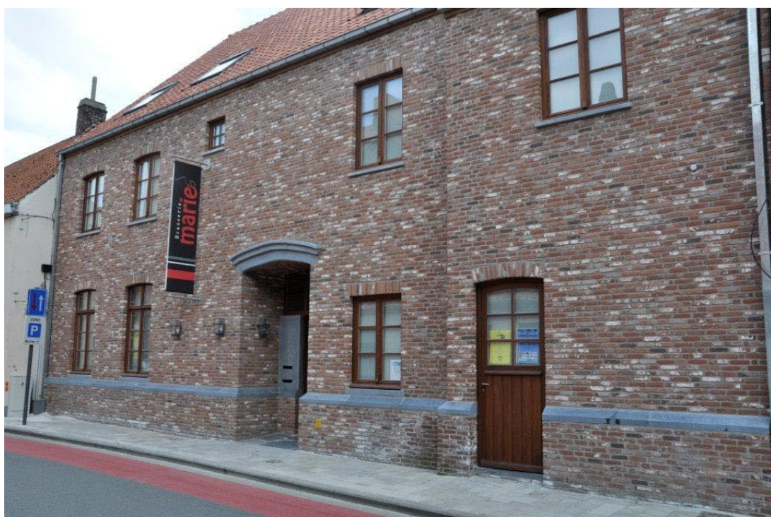
Situatie anno 2017