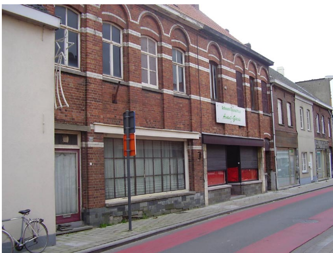
Op deze foto, toen was er geen café meer, zien we de aanpassingen aan de benedenverdieping. Het gangske aan de rechterkant is duidelijk te zien. Het gaf toegang tot de twee kleine huisjes te zien op de foto hieronder.