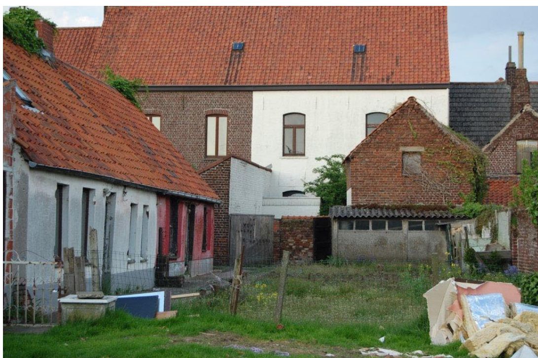
De twee huisjes die via het gangske bereikbaar waren. Gesloopt in 2010.