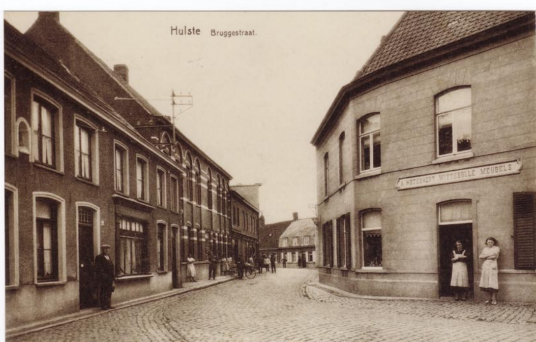
Op deze postkaart zien we nog de oorspronkelijke opbouw van het huis, getypeerd door het gebruik van witte steen ondermeer de als banden doorgetrokken onder-, tussen- en bovendorpels en de rondboognissen.